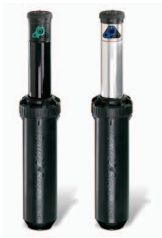
Beachte: Die Aufsteigerhöhe ist vom Deckel bis zur Mitte der ersten Düsenöffnung gemessen. Die Gehäusehöhe gilt bei eingefahrenem Aufsteiger.

8005: 1" (26/34) IG (BSP), Aufsteiger aus Kunststoff 8005-SS: 1" (26/34) IG (BSP), Aufsteiger aus Edelstahl