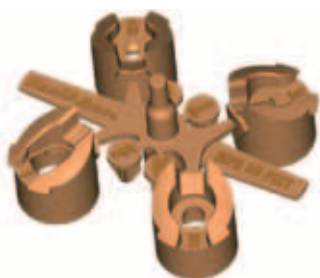
Kleiner Düsensatz mit 4 Düsen

5000MPRMPK: Beutel mit 30 Düsensäumen 5000-MPR: 10 x 5000-MPR-25, 10 x 5000-MPR-30, 10 x 5000-MPR-35