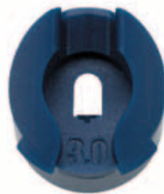
Rain Curtain Düse - Vorderansicht