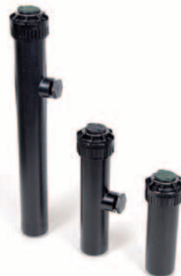
Modell 5000 Plus

MPR-Düsen vereinfachen die Planung einer Beregnungsanlage, denn die Durchflussmengen der unterschiedlichen Düsen-Sprühbilder sind aufeinander abgestimmt und es können Regner mit verschiedenem Sektor und Wurfweite auf der gleichen Leitung installiert werden. Sie sind für alle Rain Bird Regner 5000/5000 Plus/ 5000 Plus PRS/UPG zu verwenden