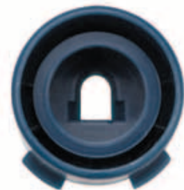
Rain Curtain Düse - Rückansicht